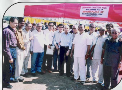
Attendance of our members at Bhoomi Pujan of Manghnani Elders Home on 26-01-2006 at Lonavla